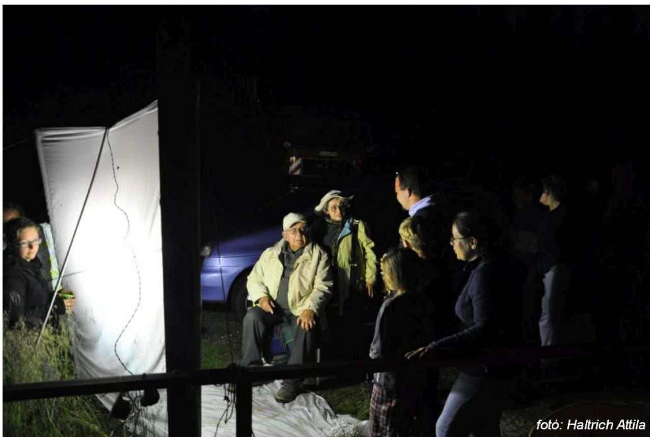
Lámpázás 1400 m-en, a Ráró-menedékház mellett, Ráró-Gyamaló hegység, 2014 július 24.

Már gyerekkorában is gyűjtött rovarokat, de ez haláláig tartó szenvedéllyé akkor vált, amikor 1975-ben Viktort vezette be a lepkészés rejtelmeibe. A nappali lepkékkel kezdte, de aztán következtek az éjjeli nagylepkék. 2000-ben már 12 ezer példányból álló gyűjteménye volt.