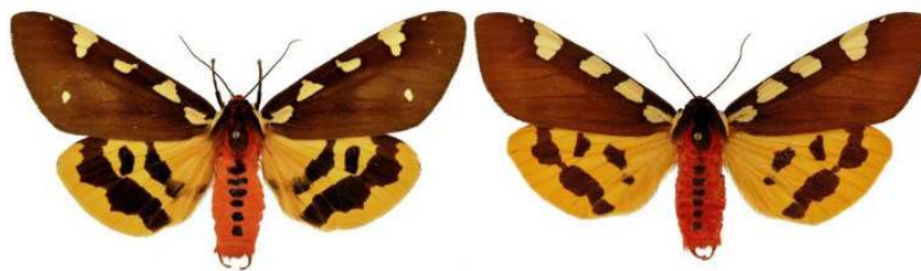
Pericallia matronula (Linnaeus, 1758) Männchen (Spannweite 80 mm)

Ausztria Noctuoidea faunáját mutatja be az a honlap , melyet a bécsi Naturhistorisches Museum Wien és a Heterocera Press kísérleti jelleggel hozott létre. A checklist összesen 730 taxont tartalmaz, melyek döntő többsége bizonyítottan honos vagy valamikor honos volt Ausztria területén, néhány várhatóan előkerülő további fajt szögletes zárójelben soroltunk fel. A fejlesztés első lépésében a revideált fajjegyzéket egy képtár egészíti ki, mely valamennyi taxont négy képen mutat be, legtöbbször két hím és két nőstény példányt ábrázolva. A képtárat mind a fajjegyzék adott elemére kattintva, mind pedig a kereső funkcióval el lehet érni. A kereső funkció mind a generikus név, mind pedig a faji jelző, illetve annak valamely része alapján működik, értelemszerűen a nem teljes név esetén egynél több taxon is megjelenhet a keresés alapján.