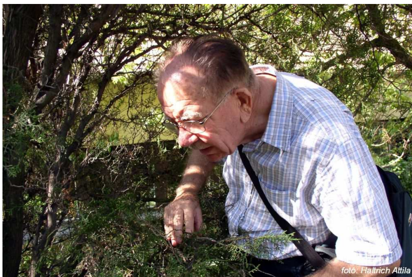
Pajzstetűgyűjtés közben a Budai Arborétumban, 2010. szeptember 17.

1975-től tagja a Virginiai Tudományos Akadémiának, 1993-tól tiszteletbeli tagja az Amerikai Rovartani Társaságnak (Entomological Society of America), 1995-től külső tagja a Magyar Tudomá-