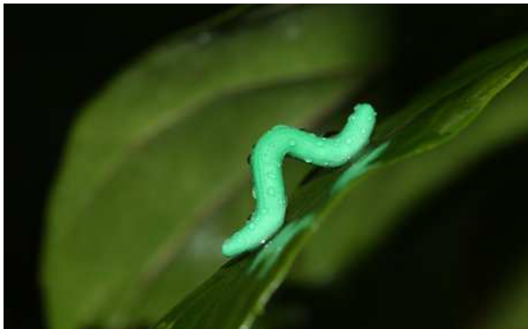
A kísérlethez használt nedvesített gyurmahernyó várja a potenciális ragadozókat, Tai Po Kau, Hongkong

Műhernyókkal leplezték le a hernyók titkait ( Index, 2017.05.22. ) A Science tudományos magazinban jelent meg az a nagyszabású kutatás, amelyben több tucatnyi kutató vett részt a világ minden tájáról, és amelyben azt vizsgálták, hogy ha műhernyókat helyeznek el szabadföldön növényekre,