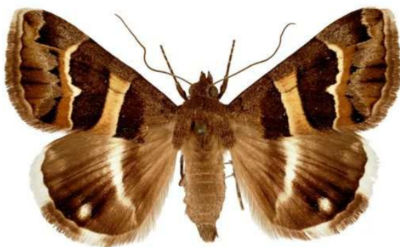
Prodotis stolidia (Fabricius, 1775) Weibchen (Spannweite 34 mm)

letve annak valamely része alapján működik, értelemszerűen a nem teljes név esetén egynél több taxon is megjelenhet a keresés alapján.