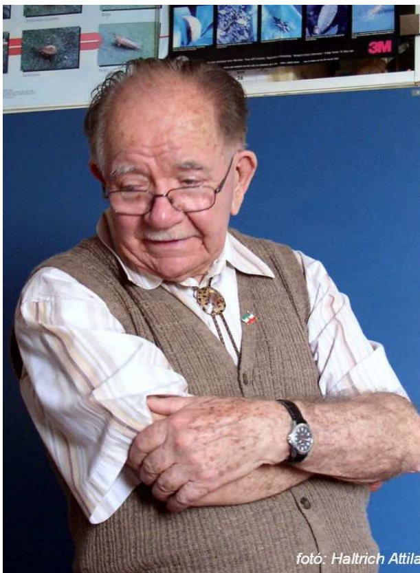
Előadás tartása után a Rovartani Tanszéken, 2010 áprilisában