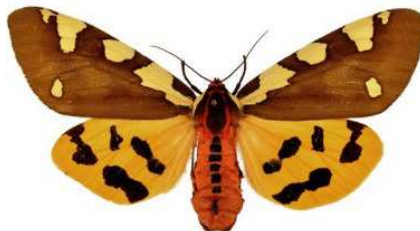
Pericallia matronula (Linnaeus, 1758) Weibchen (Spannweite 82 mm)