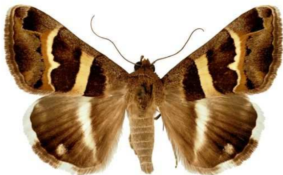
Prodotis stolidia (Fabricius, 1775) Männchen (Spannweite 34 mm)