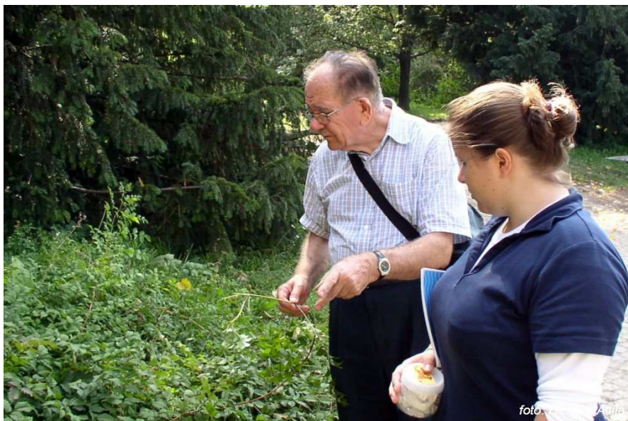
Pajzstetűgyűjtés közben a Budai Arborétumban, 2010. szeptember 17.