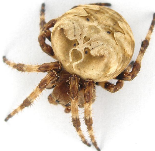
Óriás keresztespók ( Araneus grossus )

Pár perc alatt felérek az első sztyeppfoltokig. A megmaradt fenyők illata a forró horvát hegyoldalak hangulatát idézi. Hőség van, de nem elviselhetetlen; ahhoz viszont elég jól süt a nap, hogy a melegkedvelő bogarak teljes aktivitással mozogjanak. Smaragdzöld virágbogarak ( Protaetia affinis ) zúgnak elérhetetlen magasságban; a cickafarkokon virágcincérek és díszbogarak hemzsegnek, köztük a sárgacsíkos zömökdiszbugár ( Acmaeoderella flavofasciata ) és az olümposzi virágdíszbugár ( Anthaxia olympica ). Tápnövényén mozdulatlanul üldögél a tündöklő méreggyiloklevelész ( Eumolpus asclepiadeus ), melynek