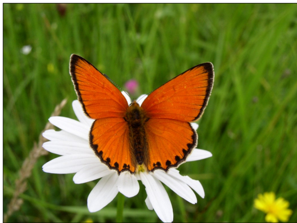
Aranyos tűzlepke ( Licaena virgaureae )